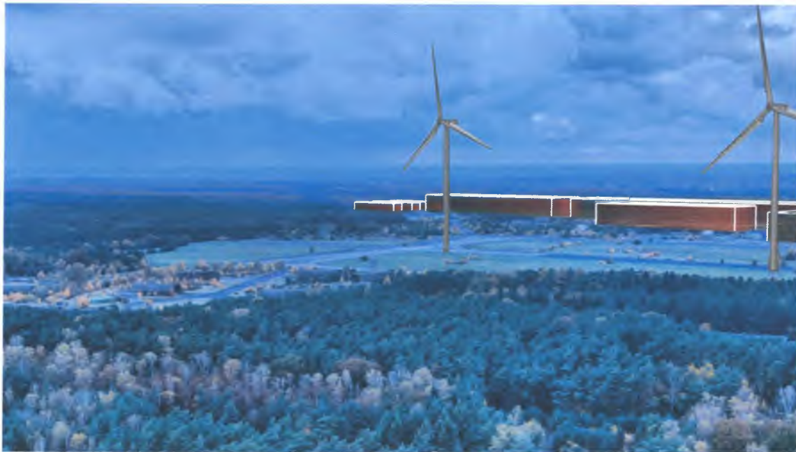
Visualisatie van het industrieterrein en de windturbines.