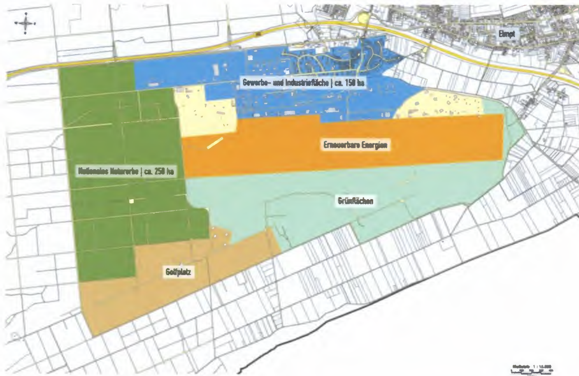
Schets van het industrieterrein.